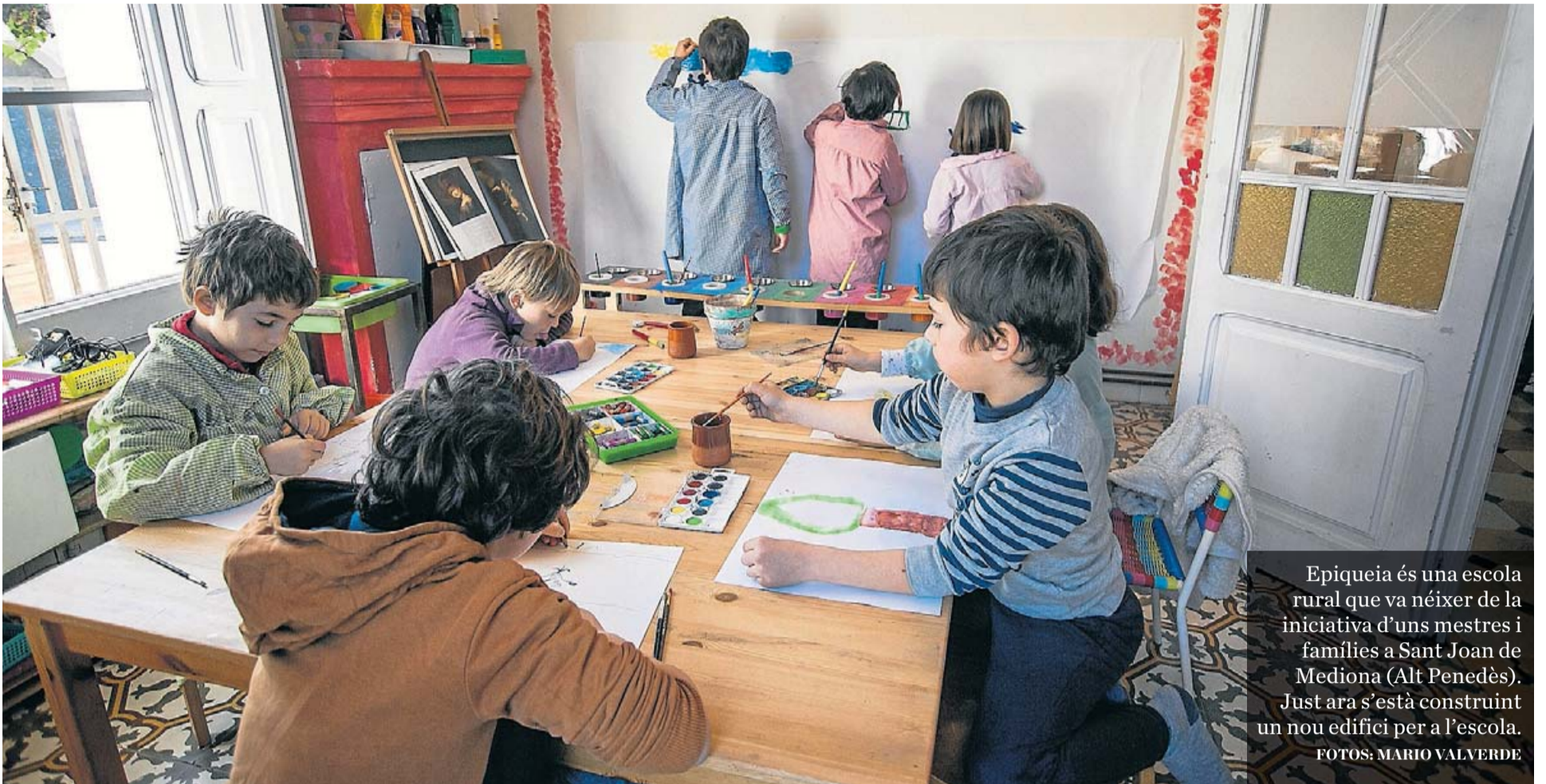
Epiqueia és una escola rural que va néixer de la iniciativa d'uns mestres i famílies a Sant Joan de Mediona (Alt Penedès). Just ara s'està construint un nou edifici per a l'escola.

marc que tenim present en tota situació i propòsit". És a dir, "el currículum esdevé un camí a experimentar i a desplegar per part dels docents en la concreció singular de la pràctica", explica Esteve.